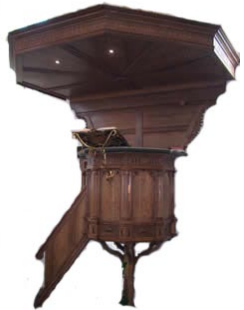
PREEKSTOEL MET KLANKBORD, HERV. KERK TE ZALM

De audio-compositie heeft de teksten die ook te lezen zijn op de foto als uitgangspunt: zoals al beschreven in voorstel 1 zal een formele benadering van de tekst de cultuurhistorische geschiedenis van diezelfde tekst inzichtelijk maken. Een element dat erbij komt in dit voorstel is het spel met representatie: de visuele spiegeling impliceert een relatie met de foto, die weer een relatie met een verteller/uitzender impliceert - en met deze implicaties wil ik spelen in de compositie. Ik ben van plan op een esthetische wijze zoveel mogelijk problemen overeind te laten: ik wil dus niet het verhaal vertellen van een zendamateur, ik wil een formeel kloppend verhaal vertellen dat de narratief in de war schopt.